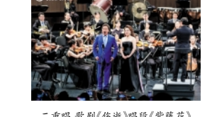
二重唱 歌剧《伤逝》唱段《紫藤花》