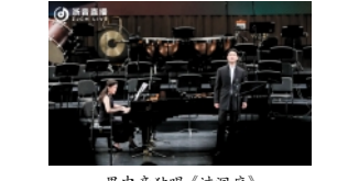
男中音独唱《过洞庭》