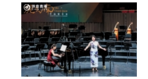
女高音独唱 歌剧《伤逝》唱段《凤凰涅》