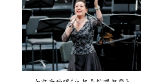
女中音独唱《打起手鼓唱起歌》