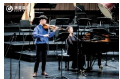
小提琴独奏《瑞丽江边》