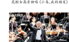
男中音独唱 歌剧《屈原》唱段《雷电颂》