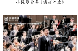
男高音独唱《我的祖国妈妈》